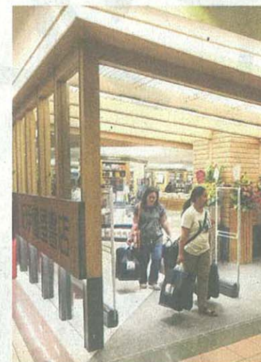
这次纪伊国屋扩充店面,将中文读物的区域增加30%。

全新的纪伊国屋书店入口处以一根巨型房柱支撑起天花板上用木质房梁间隔排列而成的装饰,远看形似展开的书本,形象地传达“开卷有益”思想,欢迎着顾客入店购书。走进店门沿途所展示的各类书籍也仿佛一盏