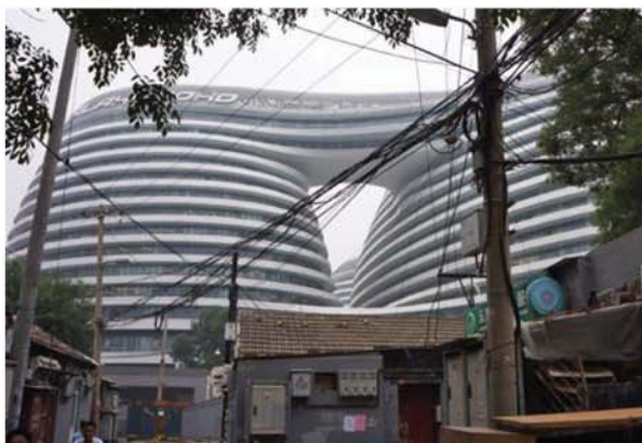
北京白色曲線條的「銀河 Soho」和朝陽區周圍老房子相鄰，造型如外來 UFO，遠看龐大無比

通常建築的設計過程，建築師會花時間推敲屋簷窗戶門扇等細部，扎哈不會：她在繪畫中一揮而就，建築、地景、周圍的道路都捲入成為設計範圍的一部