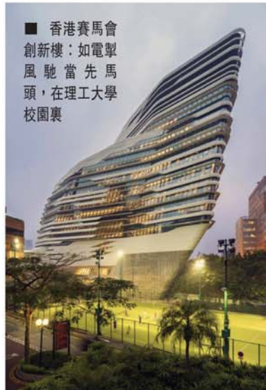
香港賽馬會創新樓：如電掣馬車風馳，當先理工大學頭，在工校園裏