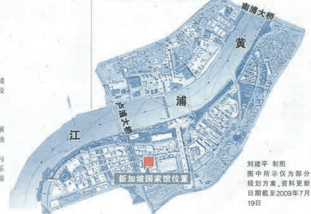
刘建平制图 图中所示仅为部分 规划方案,资料更新 日期截至2009年7月 19日

展馆主题: 城市交响曲 展馆面积: 3000平方米左右 建筑识别: 灵动“音乐盒” 建筑特色: 音乐喷泉、视听互动、屋顶花园共同形成一曲完美的协奏